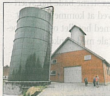
Gråsten Landbrugsskole har lovet, at siloen kommer væk.

– Ombygningen tager vi etapevis, efterhånden som det lykkedes at få midler via fonde. Om vi når det inden 2017? Selvfølgelig, lyder det overbevisende.