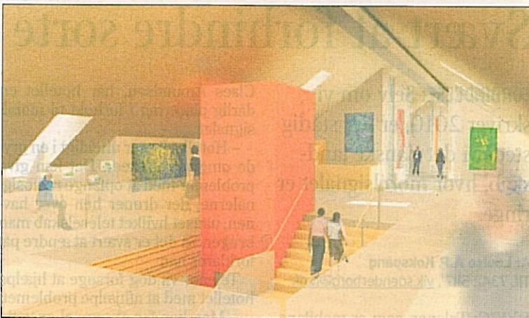
Sådan foreslår arkitekten, at kulturkraftcentret kan se ud.